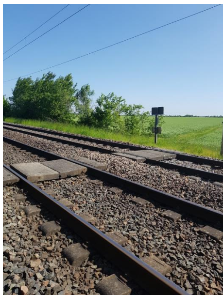
Vue générale du passage piétons sens BLESME vers CHAUMONT