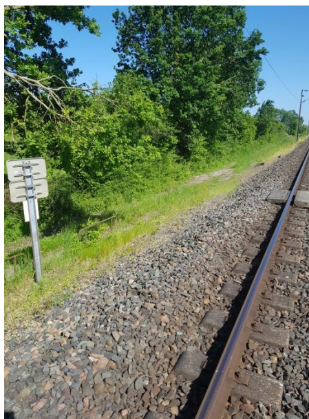
Vue du chemin latéral côté Nord