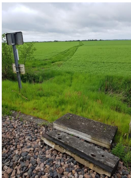
Côté Sud trace de chemin agricole