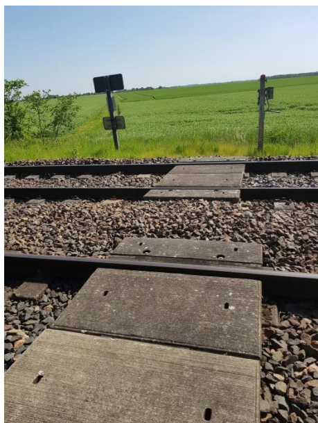
Platelage vu vers le sud

Les photos ci-dessous visualisent le contexte du PN 09.